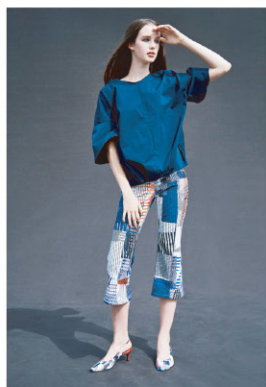
PHOTO:2017SS JAPAN / Women's

1984年ブランドアップ。1995年パリ アトモスフェール展に参加し、ヨーロッパ、アメリカなど世界10ヶ国に輸出販売を開始。グローバルな視点と価値観を持ち、女性である事を楽しむ大人の女性がターゲット。個性的で華のある服で、オリジナリティのある素材開発と特殊加工等に特徴がある。